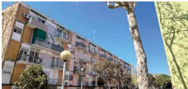
Imatge del Passatge Sant Elies