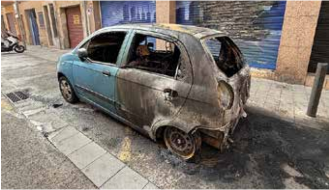
Un vehicle cremat al barri d'Artigues