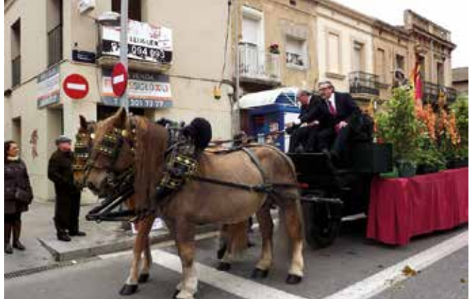
Imatge d'arxiu de la Passada

La jornada començarà a les 11:30 h des del carrer Salvador Espriu, punt de sortida del recorregut. La comitiva passarà per carrers Miquel Servet, Sagunt, Alfons XII, Maria Auxiliadora, Indústria, Roger de Flor i Pep Ventura. Després, tornarà a passar pel carrer Sagunt i continuarà per Guifré fins a arribar a La Plana, on cap a les 12:45 h es farà la tradicional be-