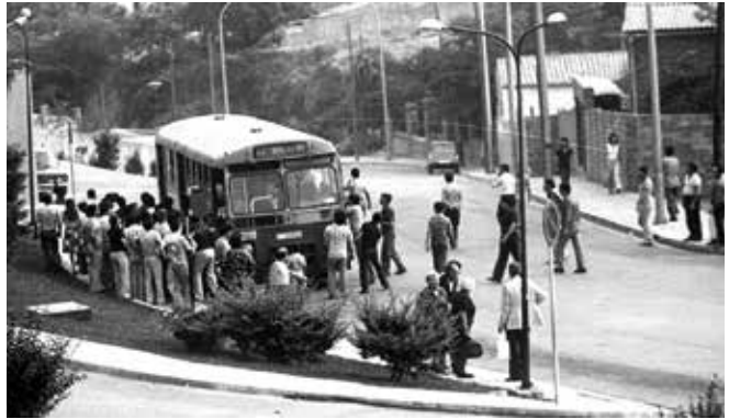
Imatge del segrest de busos a Pomar, el 1985

El 1985, ara fa 40 anys, el barri de Pomar va ser escenari d'una destacada mobilització veïnal liderada principalment per dones. La reestructuració del transport públic, arran de l'arribada del metro a Badalona, va eliminar la línia d'autobús BS-TP que connectava directament Pomar amb el centre de Barcelona. Aquesta modificació va obligar els residents a utilitzar diverses combinacions de transport, incrementant tant el temps de desplaçament com les despeses. Davant aquesta situació, les veïnes van organitzar protestes que incloïen el segrest simbòlic de 14 autobusos, forçant-los a completar el recorregut original fins a Pomar. La nit amb més tensió va ser la del 3 al 4 de maig: 400 policies van intervenir per recuperar els vehicles. Tot i que ho van aconseguir, l'alcalde de Badalona d'aleshores, Joan Blanch, va comprometre's a resoldre el problema. Aquestes accions van ser determinants per restablir una connexió directa amb Barcelona, donant lloc a l'actual línia B25. Aquesta història recorda la pel·lícula "El 47", que narra el segrest de busos a Torre Baró. Es va estrenar amb èxit el passat setembre. Produïda per Mediapro, els actors protagonistes són, entre d'altres: Eduard Fernández, Clara Segura i Zoe Bonafonte.