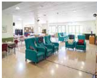
Imatge de l'interior de la residència Serentill

Badalona compta amb un total de 807 places residencials per a gent gran, de les quals només 196 són públiques, mentre que les places privades arriben a 611, gairebé triplicant l'oferta pública. Aquest desequilibri posa de manifest la manca de places públiques en comparació amb la demanda creixent de la població d'edat avançada. Des de fa temps és un repte que requereix l'atenció de les administracions per garantir una oferta més equitativa i accessible per a les famílies badalonines. La situació destaca la necessitat de reforçar els serveis públics i ampliar les opcions accessibles per a la gent gran de la ciutat.