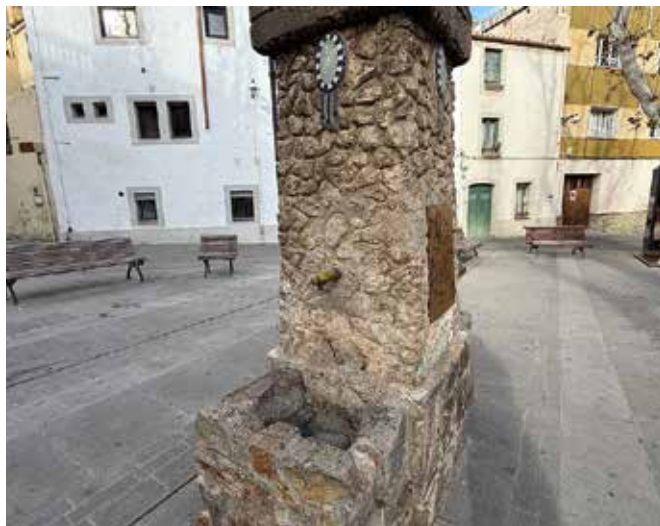
Imatge de la font de la plaça Pau Casals