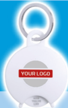
Llavero Moneda Antibacteriano Portis