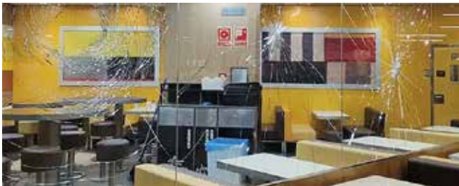
Imatge de l'interior del Màgic Badalona