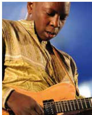
Un any més, torna el Blues i Ritmes a Badalona