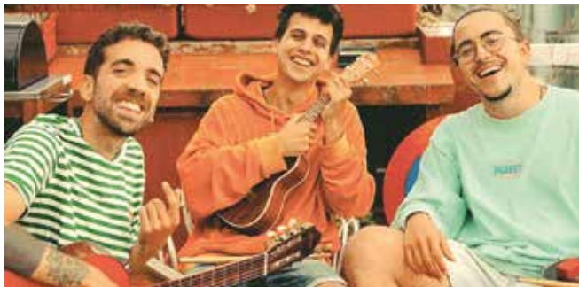
Els Stay Homas actuaran per les Festes de Maig