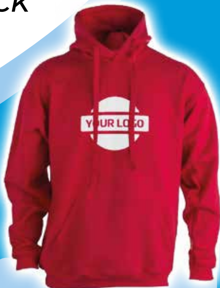
Sudadera Adulto con Capucha "keya" SWP280 - Rojo