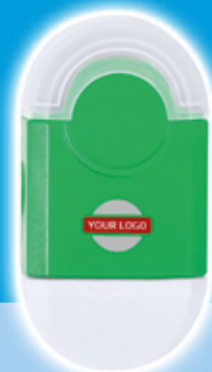
Set Cafey - Verde goma y sacapuntas