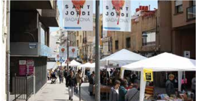
Imatge d'arxiu del Sant Jordi a Badalona

Badalona ja té a punt la programació del Sant Jordi 2024. El primer acte, i un dels més tradicionals, és la Fira del Llibre. Com els darrers anys, els llibreters muntaran les seves parades a la plaça Pompeu Fabra, i no a la plaça de la Vila com era tradicional. La fira obrirà de divendres 19 i fins al mateix dia de Sant Jordi. Durant els quatre dies trobareu les típiques parades per a la venda de llibres amb la col·laboració dels llibreters de Badalona. Els 22 d'abril, durant tot el dia, a les carpes de les llibreries hi haurà signatures de llibres