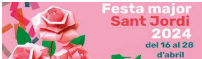
Cartell de la Festa Major de Montgat

vistes destaquen l'Enotast DO Alella, el Tastet de Favas a la Plaça de les Mallorquines i el Correfoc Infantil amb les colles Diablers de Montgat i Diablons de Caldes d'Estrac, pel divendres 19. La festa acabarà el 23 d'abril amb el castell de focs.