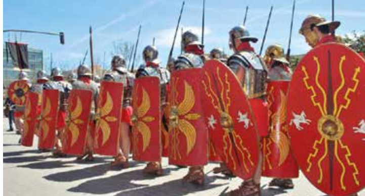
Imatge d'arxiu de la Magna Celebratio

El Museu de Badalona torna a programar, aquest any, una nova edició de 2024, de la Magna Celebratio. Aquesta és una de les activitats principals que es porta a terme per tal de difondre el món romà al voltant de Bètulo. El Museu és l'organització encarregada d'un festival romà centrat en la reconstrucció històrica, anomenat Magna Celebratio que té lloc des de