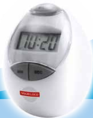
Temporizador Holly - Blanco