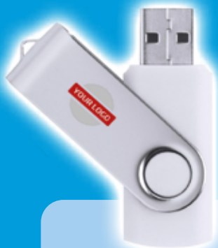
Memoria USB Yemil 32GB - Blanco