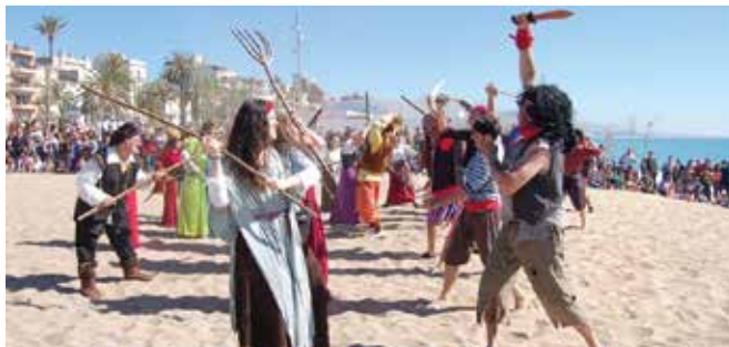
Imatge d'arxiu del desembarcament pirata

Aquest cap de setmana arriba el plat fort de la 24a edició de la Festa Medieval de Badalona. Un dels actes més esperats és el desembarcament pirata a la Platja dels Pescadors, aquest dissabte al matí, seguit de diferents activitats que acollirà la Masia de Canyadó, com la seva "cremada" dissabte a la nit. De cara a diumenge, 14 d'abril, arribaran les danses medievals, l'espectacle teatral d'equitació i combats medievals, a la Baixadeta de Canyadó, o espectacles de màgia. Tot plegat, durant un cap de setmana que Badalona tornarà