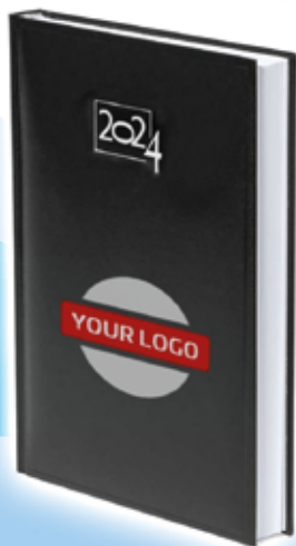
Agenda Cannes - Negro