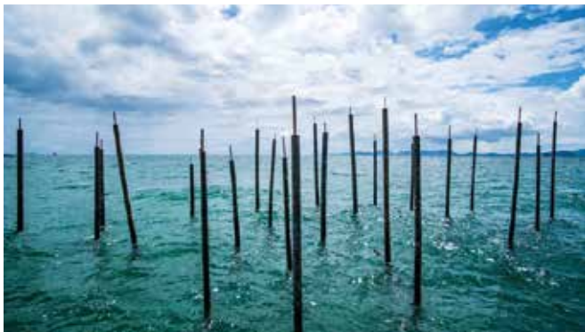
Recreació del que es podrà veure a la platja del Coco

La platja del Coco serà la seu principal a Badalona de la biennial nòmada europea Manifesta 15 Barcelona Metropolitana, una iniciativa que tindrà lloc del 8 de setembre al 24 de novembre a Barcelona i a la seva regió metropolitana. Durant aquestes dates, s'ubicarà al litoral badaloní l'obra 'Rumours from the sea' de Félix Blume una instal·lació artística que dona veu i vida al mar i musicalitza la immensitat de la nostra costa. A més, en el marc del Manifesta es desplegarà un