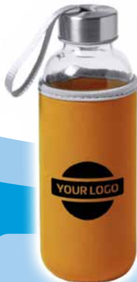
Bidón Dokath - Naranja