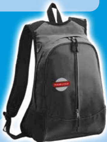
Mochila Empire - Negro