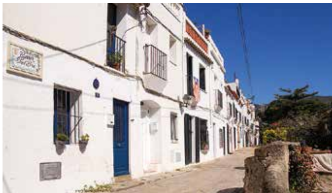
Carrer Sant Bru de Tiana